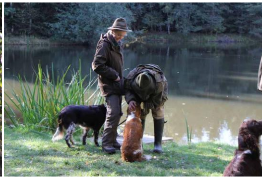
Bei der Wasserarbeit