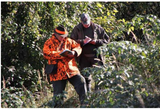
Alle Leistungen werden genau protokolliert.