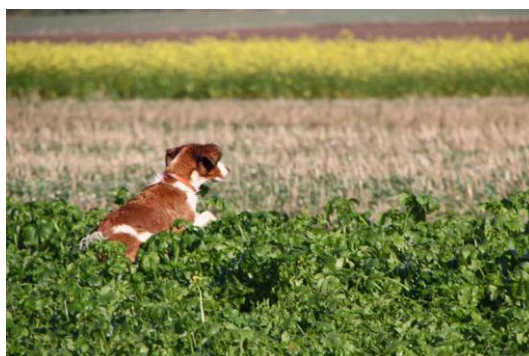
...ambitioniert auf der Spur